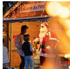
Soorts-Hossegor en fête, c'était magique !