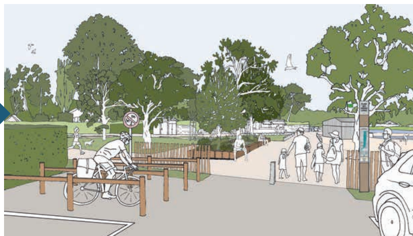
Parking d'accès à la plage du Parc.

Pour les secteurs situés à proximité immédiate d'habitations, au niveau de la plage des Chênes-Lièges par exemple, le projet veille à préserver l'intimité des riverains notamment grâce à des massifs plantés.